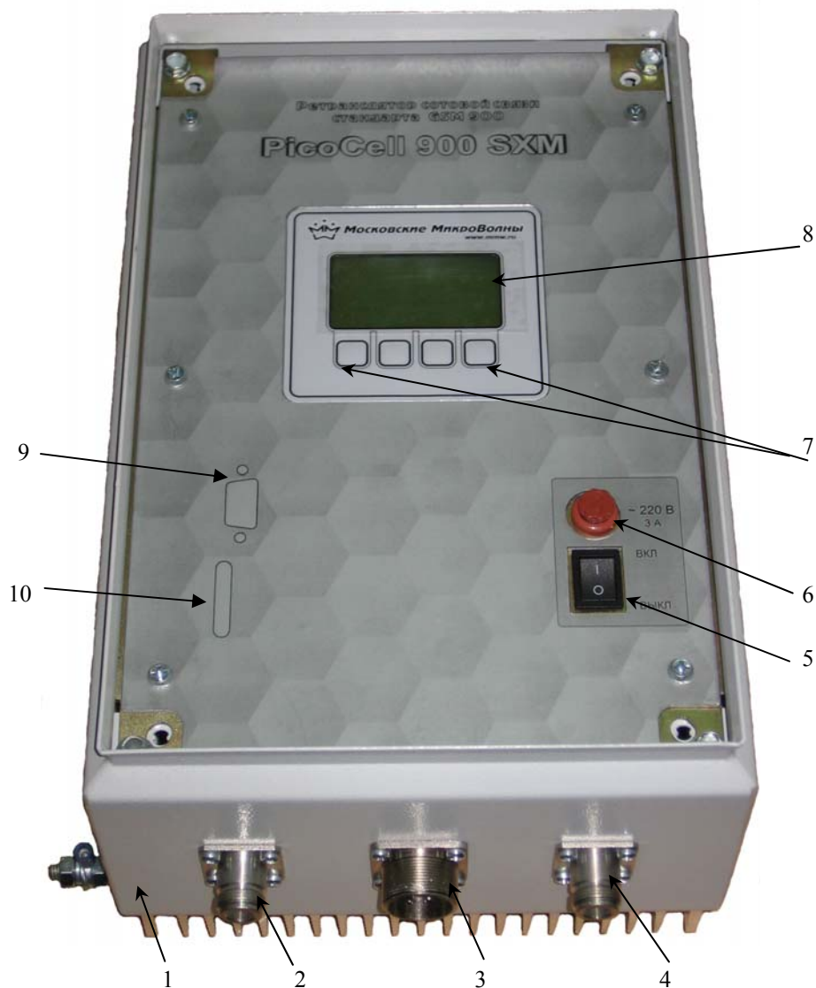
Рис.1 Ретранслятор PicoCell 900 SXM

Вся информация, необходимая при настройке системы, при монтаже и при дальнейшем обслуживании, отображается на графическом ЖК-дисплее, расположенном на корпусе ретранслятора. Настройка производится с клавиатуры, расположенной под дисплеем, с помощью русскоязычного меню.